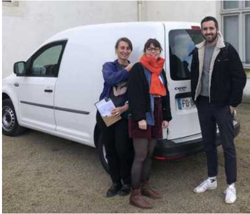
L'équipe du MAT et la Matmobile

Première circulation à l'automne 2024 sans mobilier spécifique.