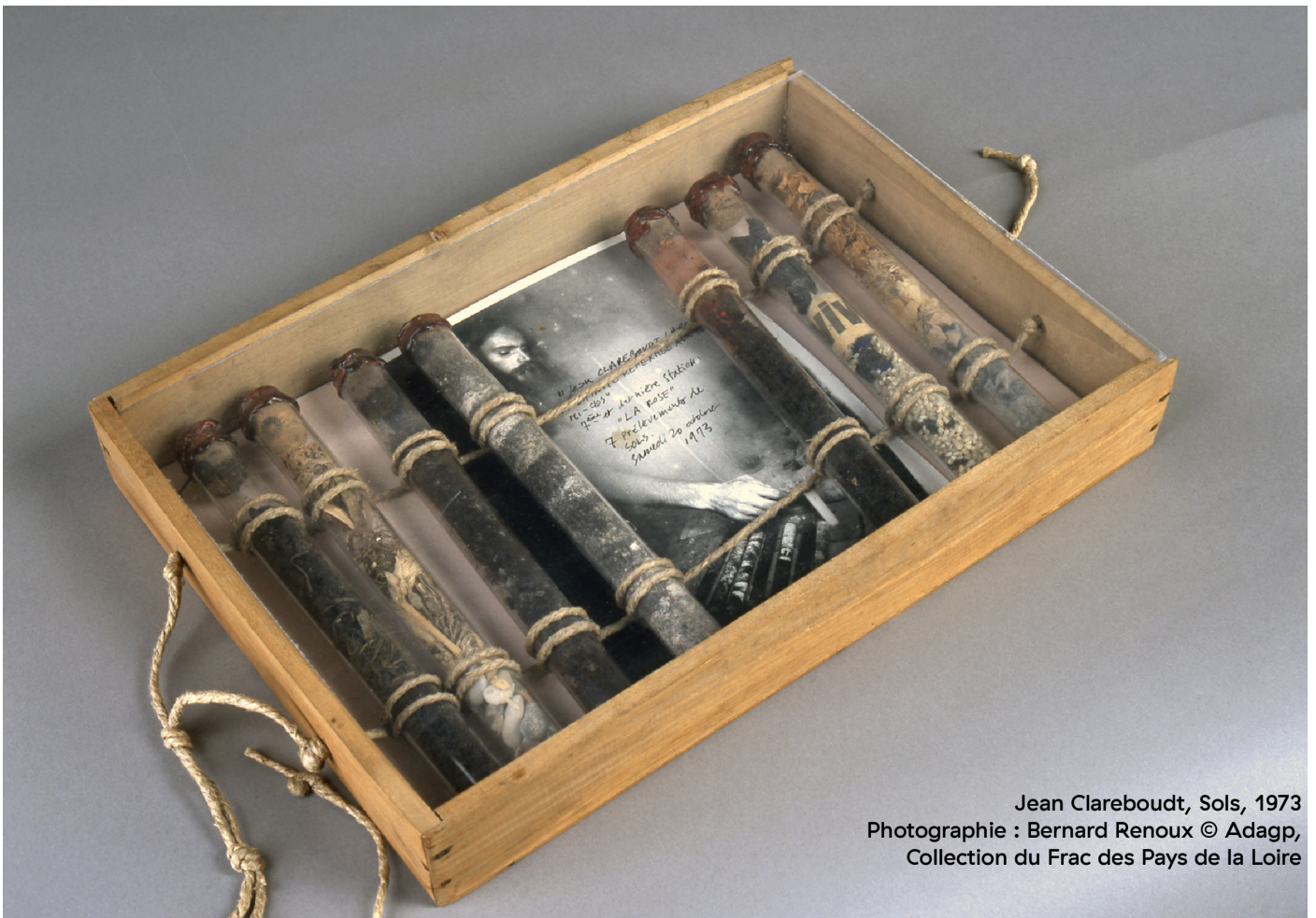
Jean Clareboudt, Sols, 1973 Photographie : Bernard Renoux © Adagp, Collection du Frac des Pays de la Loire