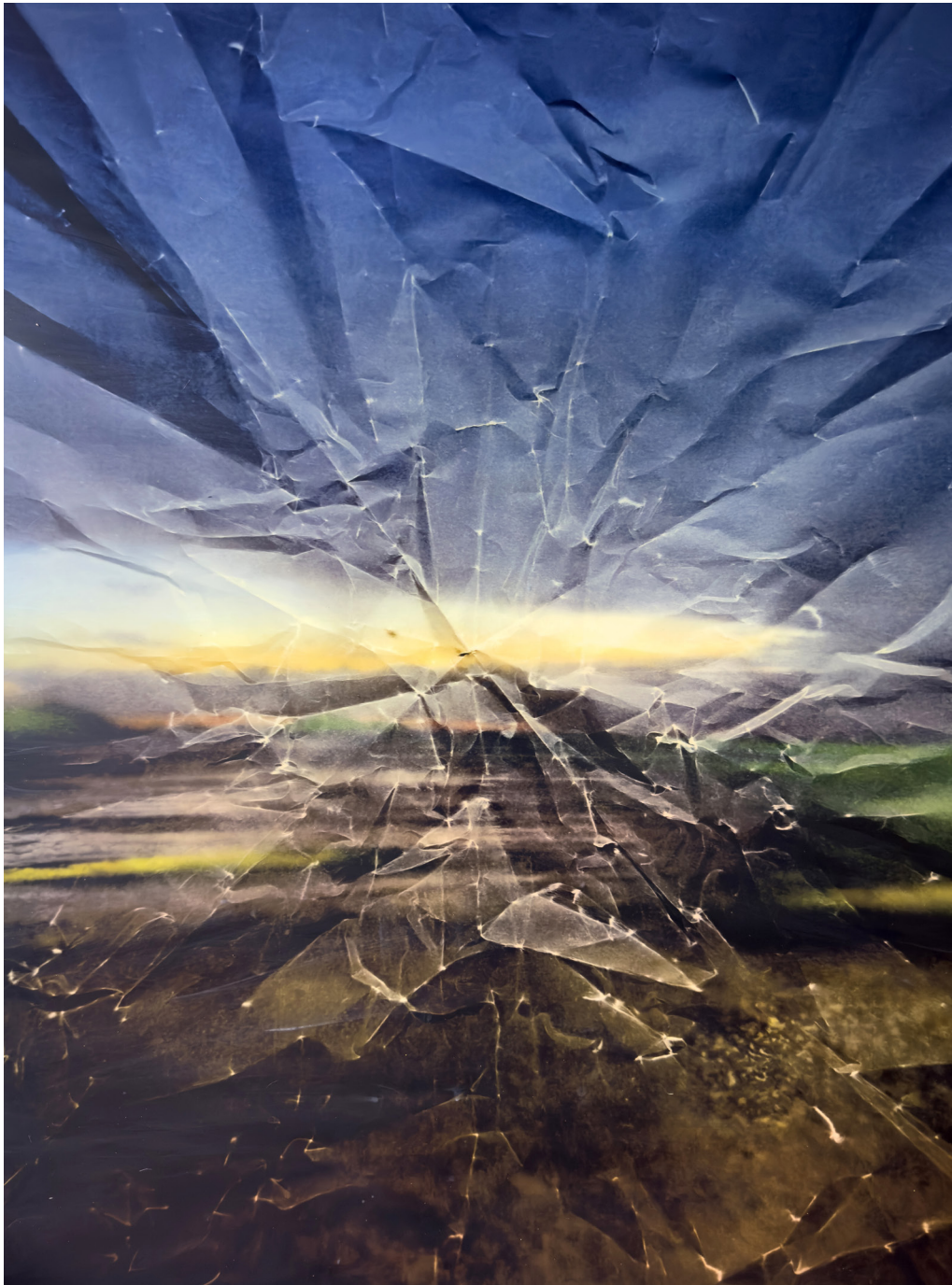
Eva Nielsen, Estrand VII , 2024

acrylique, encre de Chine, latex et sérigraphie sur toile, 180 x 130 cm